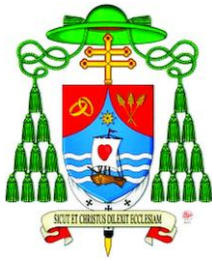
Lo stemma del nuovo Arcivescovo mons. Giampaolo

Abbiamo bisogno di persone che ci aiutino a guarire le ferite che ci portiamo dentro e quelle infermità personali e sociali che ci impediscono di vivere da fratelli che si sostengono e si aiutano vicendevolmente.