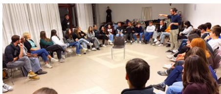
Partito il gruppo dopocresima dei giovani, i mitici "Cercatori", con i loro bravi educatori. Bravi!