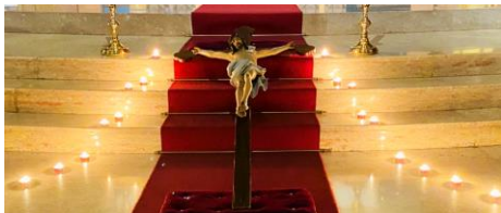
Intense le Via Crucis su "Conflitto e pace" per le vie del paese, Qui un'immagine da Cervignano.