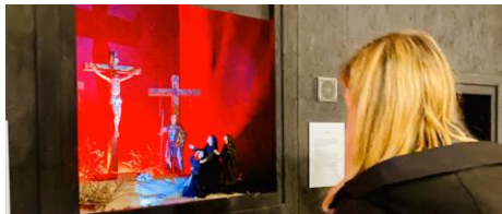
Il "Presepe pasquale" in Duomo continua ad attirare fedeli e visitatori. Da non perdere!