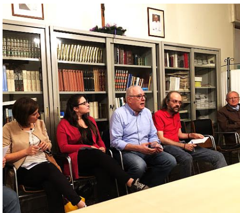
Il Consiglio pastorale incontra i responsabili diocesani della Caritas in vista di nuove iniziative.

Questo, a nome di tutte le comunità cristiane di cui facciamo parte nella nostra Unità Pastorale.