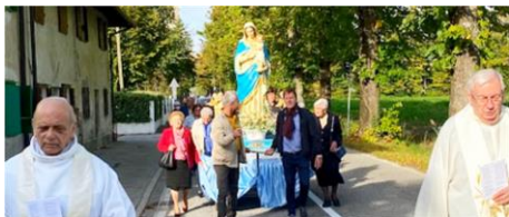
Anche Scodovacca ha vissuto la festa del Rosario con la Messa, la processione e il convivio finale.