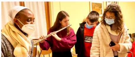
I giovani del gruppo delle superiori "I Cercatori" concludono con il canto il loro incontro.