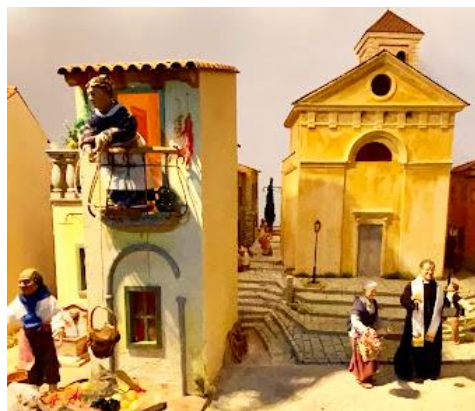
Il Gruppo Presepi si autofinanzia per realizzare le splendide composizioni natalizie.

educativa verso i nostri ragazzi? Viene spontaneo pensare alle due proposte di referendum recentemente dichiarate inammissibili dalla nostra Corte Costituzionale.