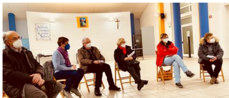
Osservazioni profonde nella prima sessione sinodale dei nostri Consigli Pastorali Parrocchiali.