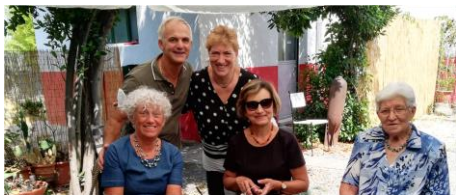
Il Gruppo Marta di Scodovacca nella festa di Santa Marta celebra adeguatamente la santa Patrona!