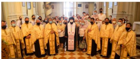
A San Michele, i presbiteri della Comunità Ortodossa Rumena attorno al Vescovo d'Italia Siluan.