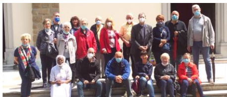
Il Consiglio Pastorale Parrocchiale di Cervignano in pellegrinaggio a Barbana, a nome della Comunità.