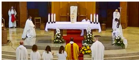
A Cervignano la Solennità del Corpus Domini celebrata con un intenso momento di adorazione.