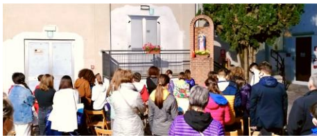
Bravi i ragazzi di Cresime2 che hanno sostenuto una serata del Rosario in Ricreatorio.