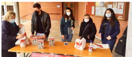
I giovani di AC offrono un quintale di riso "per una cosa seria" e oltre 800 € per le missioni in Africa.