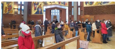
La celebrazione delle ceneri per i ragazzi della catechesi, mercoledì 17 febbraio.