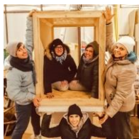
Parte del Gruppo Presepisti: un anno di intensa attività per i meravigliosi presepi in Duomo!