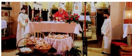
Anche la Comunità di Scodovacca ha celebrato San Biagio con la Messa in lingua friulana.