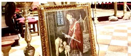
A Terzo celebrata in semplicità la festa del Patrono San Biagio, Vescovo e martire.