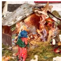
Particolari dei presepi di Muscoli e di Scodovacca. Grazie a tutti i volontari che li hanno preparati.