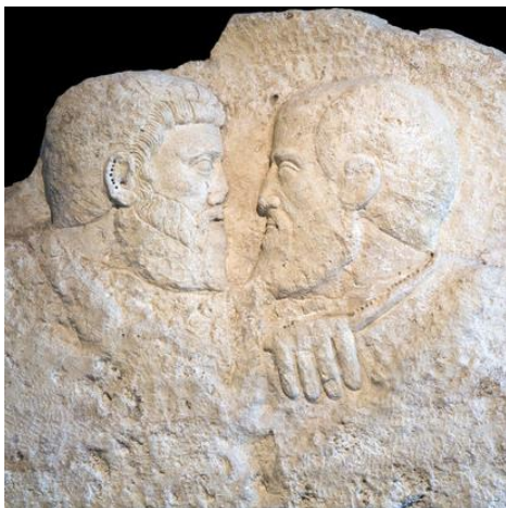
Aquileia, bassorilievo con s. Pietro e s. Paolo

S. Pietro rimase fino al 1846 il papa che aveva governato più a lungo di tutti con i suoi 25 anni, poi venne Pio IX con i suoi 32 anni di governo; Giovanni Paolo II ha raggiunto anch'egli il quarto di secolo come s. Pietro.