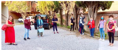
Le catechiste dell'UP preparano le celebrazioni di fine anno catechistico che si terranno in settimana.