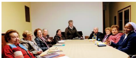
Parte del gruppo CVS durante la formazione mensile sul valore della vita e della sofferenza.