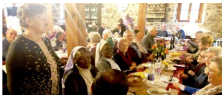
Il pranzo con gli anziani a Strassoldo organizzato dal bravo e vivace Gruppo Giovani.