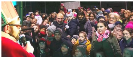
Riuscitissimo l'incontro con San Nicolò promosso dal Ricreatorio San Michele. Felicissimi i presenti.