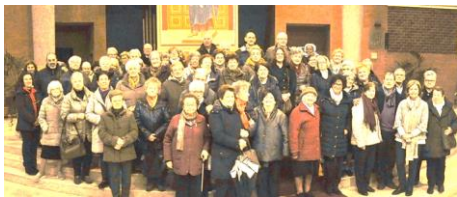
Le Zelatrici per il Seminario all'incontro di preghiera in Duomo a Cervignano lunedì scorso.